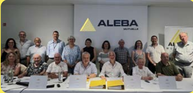
HAUPTVERSAMMLUNG DER MUTUELLE DE L'ALEBA